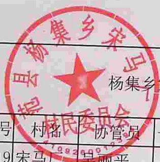
杨集乡宗教协管员工资发放表 (2020年10---12月份)