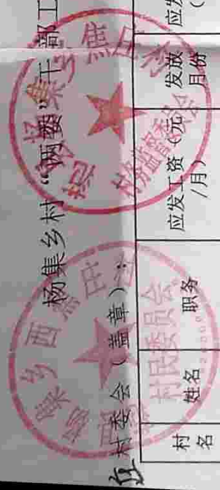
杨集乡村“两费”干部工资表 (2021年第二季度工资)