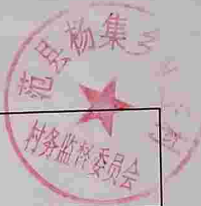
杨集乡宗教协管员工资发放表（2020年10—12月份）