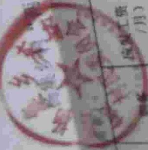
物家乡木塔村“两委”干部工资表 (2022年3月-2022年6月)