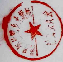
颜村铺乡胡楼村2023年9-12月份正常离任村干部工资表