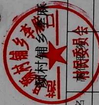
李铺乡李铺村2023年9-12月份正常离任村干部工资表