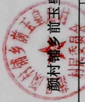
前玉皇庙村2024年1-6月份正常离任村干部工资表