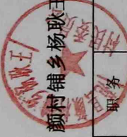
颜村铺乡杨耿王村2023年9-12月份正常离任村干部工资表